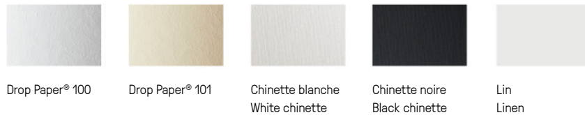
Drop Paper® 100