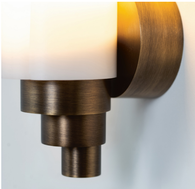
Détail Scala BZ

* Les luminaires variables nécessitent l'utilisation d'ampoules compatibles avec la variation. All dimmable light fixtures require the use of compatible bulbs.