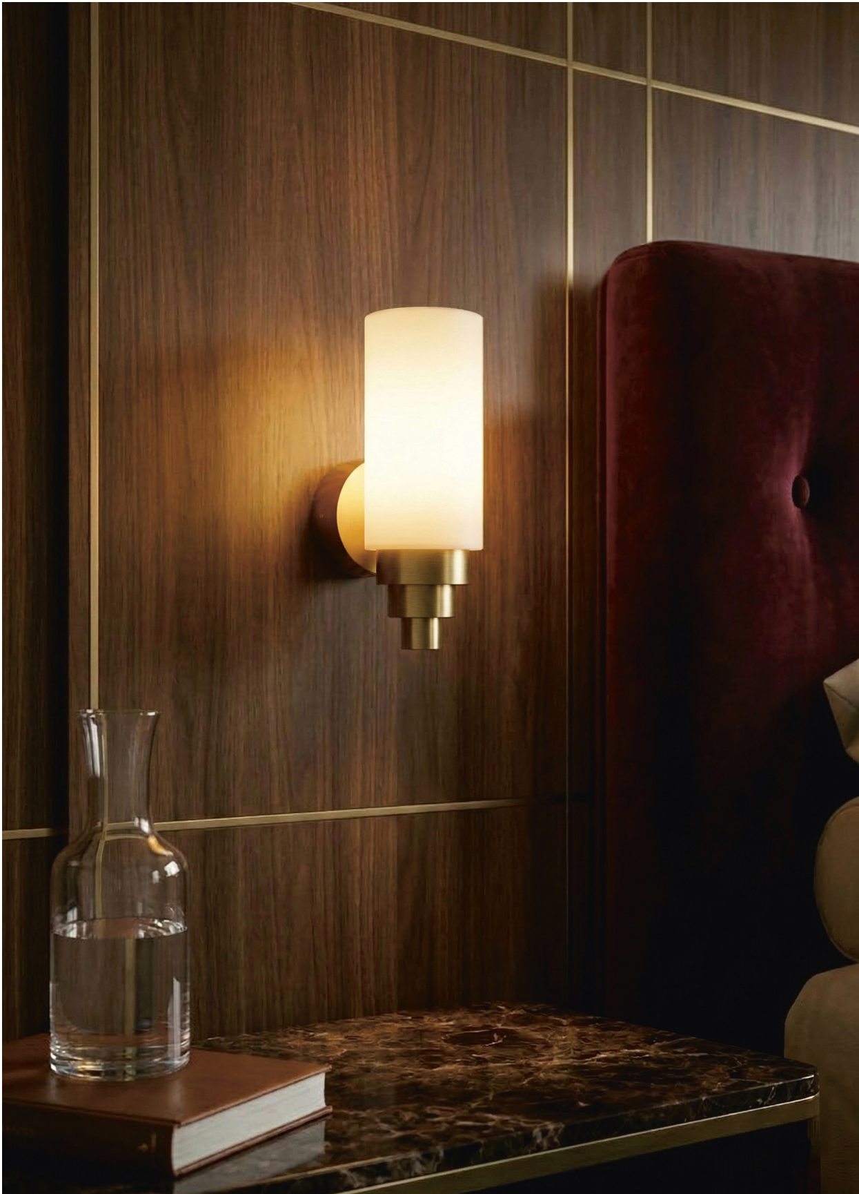
Naboo Réflecteur + Spot VS SB